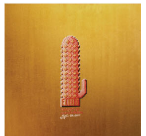
DILDO weapon of masturbation