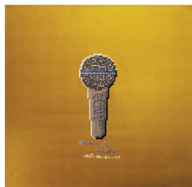
MIC freedom of speech