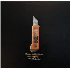
CUTTER love will tear us apart