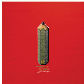
PENCIL munition of style