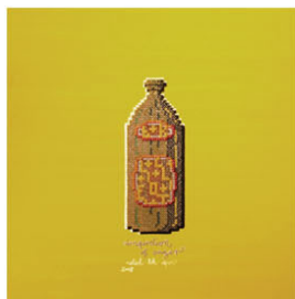
BIER inspiration of anger