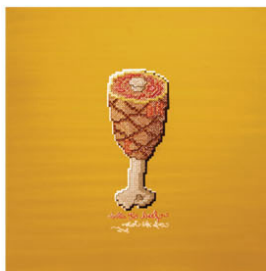
BEEF balls to beef