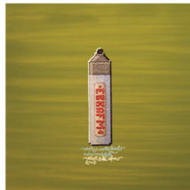
MARKER arty collateral damage