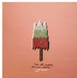
EIS we all scream for ice cream